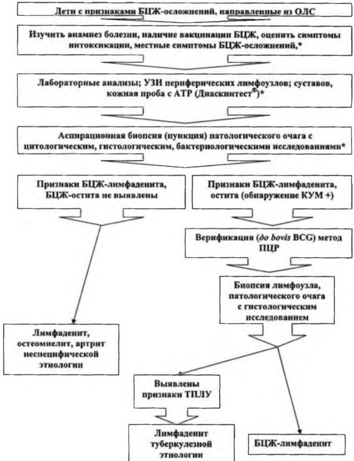
Схема 2. Алгоритм дифференциальной диагностики БЦЖ-осложнений у детей в условиях туберкулезного учреждения