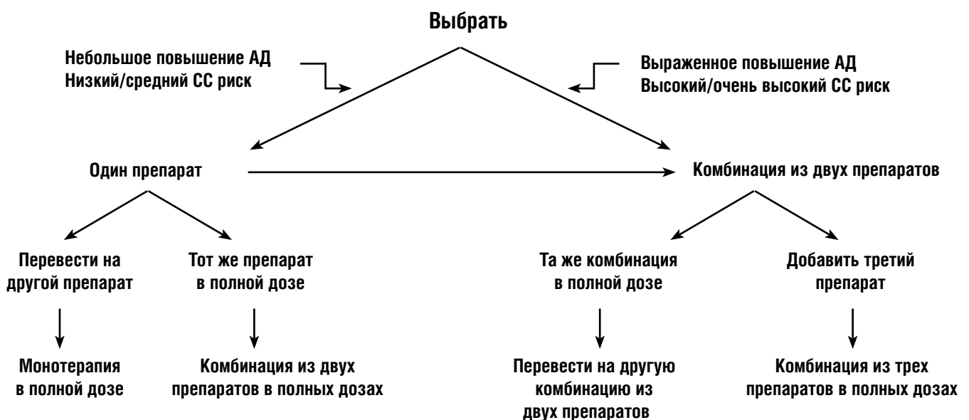
Рисунок 3. Сравнение тактики монотерапии и комбинированной фармакотерапии для достижения целевого АД. Во всех случаях, когда целевое АД не достигнуто, нужно переходить от менее интенсивной к более интенсивной терапевтической тактике.

Если терапию начинают с одного или с комбинации двух препаратов, их дозы можно постепенно увеличивать, при необходимости, до достижения целевого АД. Если на комбинации двух препаратов в полных дозах целевое АД не достигается, можно перевести пациента на другую комбинацию из двух препаратов или добавить третий препарат. Однако в случаях резистентной АГ при добавлении каждого нового препарата нужно внимательно отслеживать результат и любой явно неэффективный или минимально эффективный препарат следует заменять, а не сохранять автоматически в рамках постепенного усиления многокомпонентной фармакотерапии (рисунок 3).